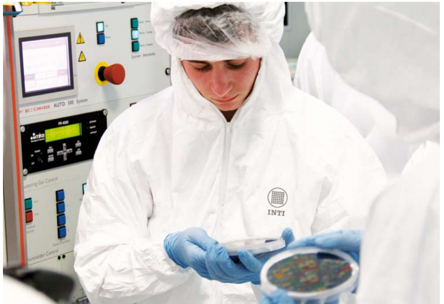
VOCACIONES TECNOLÓGICAS. Estudiantes de nivel secundario premiados por la Fundación Argentina de Nanotecnología experimentaron trabajar en la sala limpia del Centro INTI-Electrónica e Informática. Ver PÁGINA 6