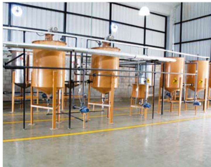
PLANTA. La certificación está destinada para pequeñas plantas de producción de biodiesel a partir de aceite vegetal usado, con un volumen máximo de 30 m 3 /día.

Atento a los requerimientos del sector, el INTI está trabajando en la implementación de un proceso de certificación de producto para determinar la calidad del biodiesel producido a partir de aceite vegetal usado (biodiesel AVU). Los especialistas del Instituto elaboraron los parámetros de la certificación a partir de normas internacionales y de análisis realizados a lo largo de dos años de trabajo sobre el biodiesel