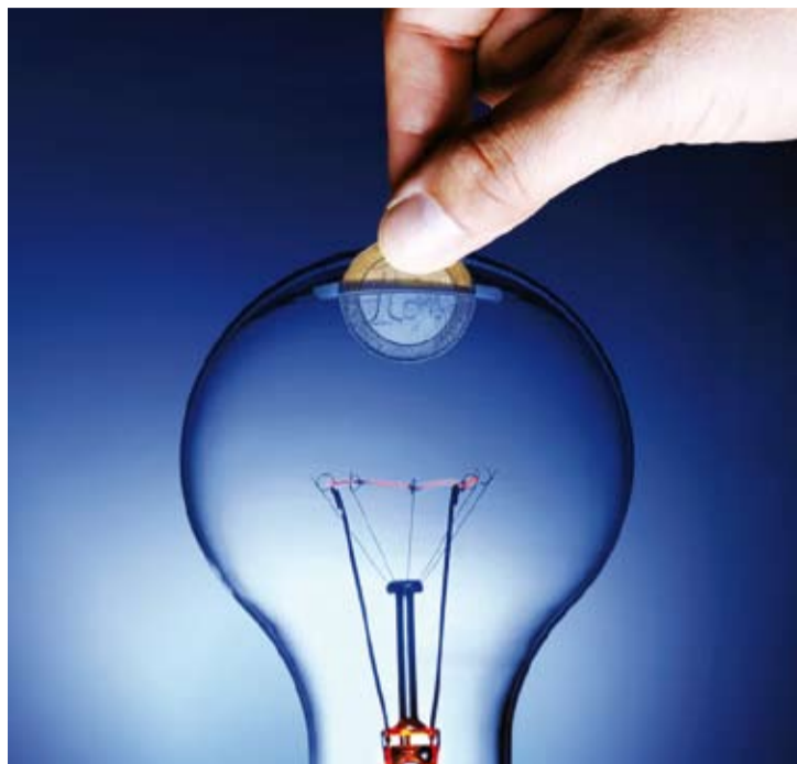
AHORRO. Aplicando diferentes medidas, en la mayoría de las instalaciones es posible reducir hasta un 30% el consumo energético.

La auditoría energética es un proceso de mejora continua que, mediante soluciones y tecnologías disponibles, permite hacer un uso racional y eficiente de la energía. Desde la ciudad santafecina de Rafaela, el INTI promueve avances en esta dirección.