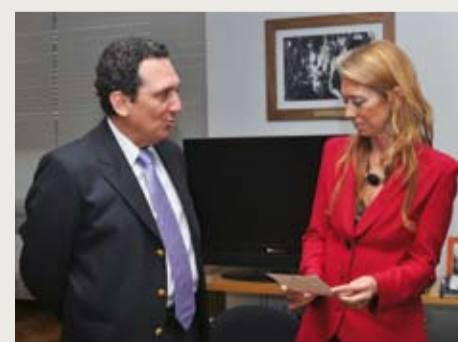
ACTO. El 10 de diciembre la ministra de Industria, Débora Giorgi, tomó juramento al nuevo titular del Instituto.