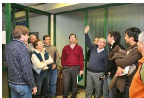
RAFAELA. Capacitación en auditorías energéticas a profesionales y técnicos de diferentes instituciones locales.

Los ahorros que se pueden obtener aplicando las auditorías energéticas son, en muchos casos, muy significativos. En función de esto, y considerando que resulta complejo detener el crecimiento del consumo de energía eléctrica, es fundamental acompañar estas iniciativas con campañas de concientización. En esta dirección, la municipalidad de Rafaela, la Universidad Tecnológica Nacional (UTN), la Asociación de Electricistas y Afines de Rafaela (ASELAF), el Centro Comercial e Industrial de Rafaela y la Región