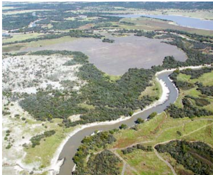
MESOPOTAMIA. La cuenca del río Guaqueguay cubre aproximadamente un 30% de la superficie total de la provincia.

INTI-Concepción y el Centro INTI-Ingeniería Ambiental se encuentran trabajando en el diseño de un Plan de Monitoreo Ambiental sobre el Río Guaqueguay (PMARG), en el marco de un convenio celebrado entre el Instituto, la Secretaría de Ambiente Sustentable de Entre Ríos (SASER) y los municipios de Federal, Villaguay, Rosario del Tala y Guaqueguay. Este estudio tendrá como base el monitoreo conjunto, constante y permanente de la calidad del Río Guaqueguay con fines de generar una línea de base, clave para el desarrollo de un Plan de Aprovechamiento Sostenible de la cuenca del río Guaqueguay y fomento de la creación de normativas que indiquen conservación de cuencas.