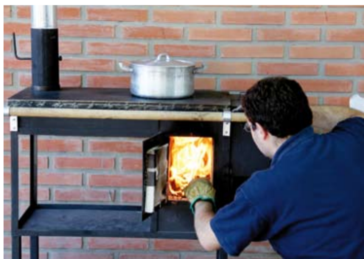
ENSAYOS. El prototipo construido se somete a diversos ensayos de desempeño en la planta piloto del Centro INTI-Energía.

El Centro de Energía del INTI diseñó el prototipo de cocina que permite la utilización indistinta de leña y de pellets de aserrín. El artefacto —al igual que las estufas mejoradas que diseñó anteriormente el Centro— se basa en la combustión de un sistema compacto de dos cámaras construidas en material refractario. En la cámara primaria se produce la pi-