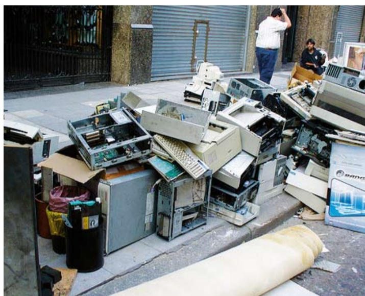
OBsolescencia. En Argentina se desechan 120.000 toneladas de basura electrónica por año.

Según estimaciones del INTI, en Argentina se desechan 120.000 toneladas de basura electrónica por año. En la ciudad de Buenos Aires el número ronda los 7 kilos por persona (el doble que en el resto del país), debido sobre todo a la gran cantidad de empresas que tienen sus oficinas en la Capital Federal. Pero no es sólo una cuestión de volumen. La presencia de ciertos compuestos tóxicos en los artefactos eléctricos y electrónicos los tornan tan o más contaminantes para el ambiente que cualquier residuo orgánico. Al ser dispuestos en un basural sin tratamiento previo, los metales pesados, sustancias halogenadas, clorofluorocarburos, bifenilos policlorados y policloruro de vinilo, entre otros elementos que suelen contener, migran hacia las napas de agua y el ambiente. Los datos locales revelan que durante el año 2010 se vendieron un millón de televisores o LCD, unos 12 millones de teléfonos celulares, 1,2 millón de impresoras y cerca de 2,65 millones de computadoras (PCs, netbooks y notebooks). Las cifras advierten sobre la creciente demanda y la rápida obsolescencia de este tipo de artefactos, cuyo descarte responsable y marcos regulatorios resultan imperiosos.