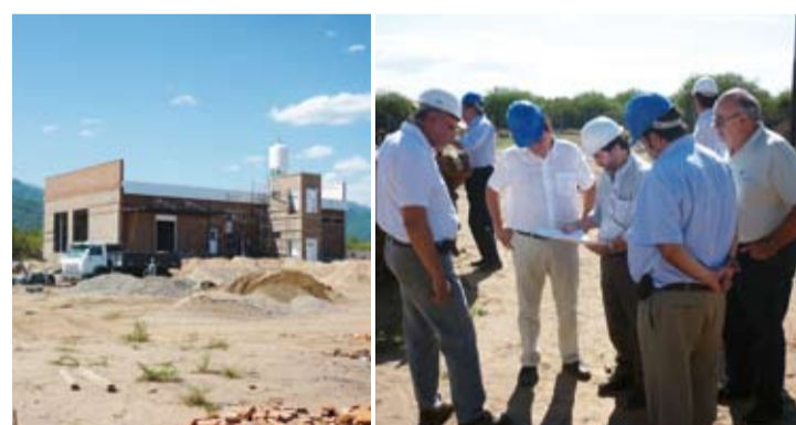
PLANTA. El frigorífico contará con un espacio de 390 m 2 donde se faenarán bovinos y caprinos.

El presidente del INTI, Guillermo Salvatierra, se reunió a mediados de enero en la provincia de Catamarca con la gobernadora, Lucía Corpachi, con la intendenta de Valle Viejo, Natalia Soria, y con diferentes áreas del gobierno provincial. Salvatierra visitó las obras del frigorífico INTI de Catamarca, uno de los diez establecimientos de ese tipo que el Instituto está construyendo en el país. La obra se inició en marzo de 2011 y está compuesta por una planta de faena de 390 m 2