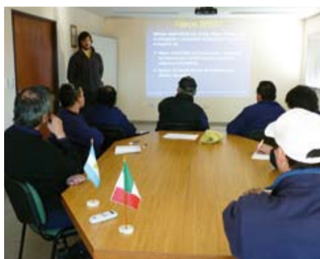
IN SITU. Asistencia en planta, una de las actividades desarrolladas con los equipos de mejoras.