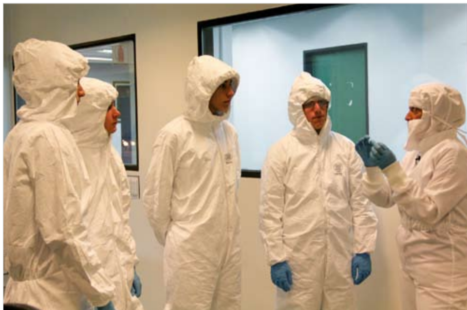
EXPERIENCIA. Alumnos premiados visitan la Unidad Técnica de Micro y Nanosistemas del Centro INTI-Electrónica e Informática.

Se presentaron 60 trabajos de tres colegios técnicos de la Ciudad de Buenos Aires y 12 fueron premiados. En la FAN aseguran que "la idea es extender el programa a todas las provincias del país". El premio consistió en una donación de 3.000 pesos al club de ciencias de la escuela para la compra de equipamiento, la visita de los alumnos a laboratorios de nanotecnología y una orden de compra de 500 pesos para la adquisición de bibliografía. El jurado del concurso fue el Consejo Asesor de la FAN que está integrado por representantes del INTI, de la