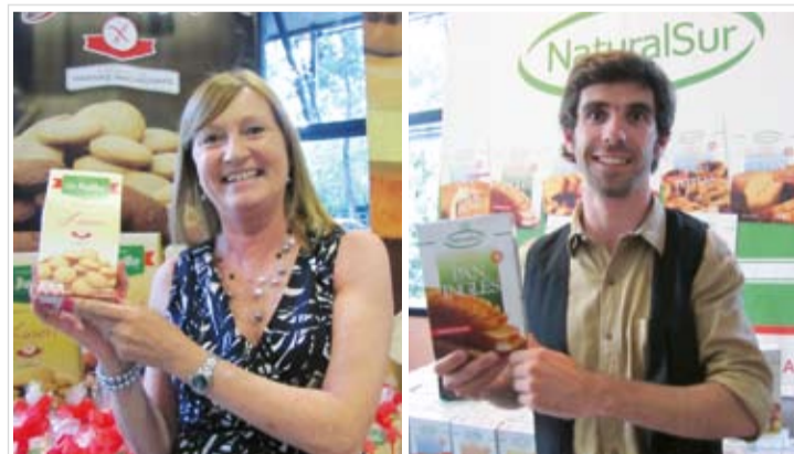
LA DELFINA. Mostró productos terminados como pan tipo lactal, galletitas y panes de hamburguesa.