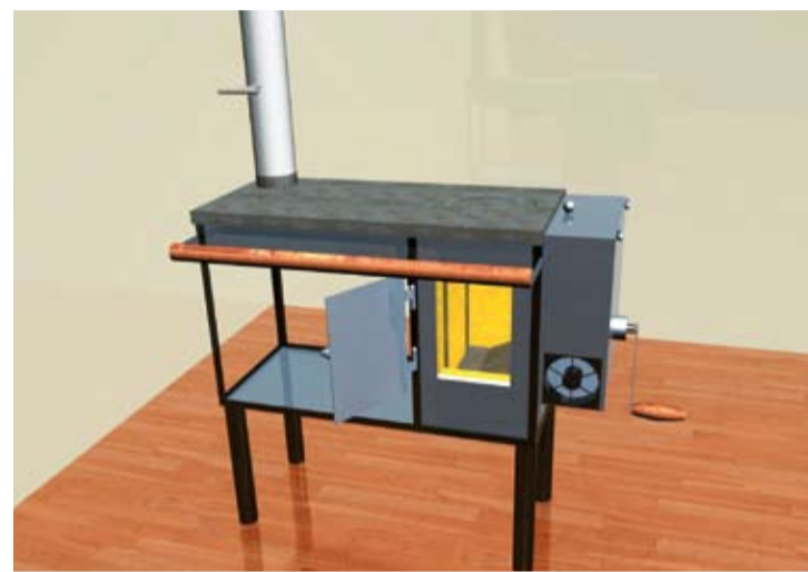
PROTOTIPO. El desarrollo se orienta hacia un producto de fabricación en serie, durable y de desempeño eficaz, tanto en lo energético como en lo ambiental.

El dispositivo experimental se completa con un sistema de monitoreo y adquisición de datos basados en un registrador híbrido y en una computadora cuyos programas de aplicación fueron también desarrollados por INTI-Energía. Junto al municipio ya se presentó un Proyecto de Desarrollo Tecnológico Municipal del Consejo Federal de Ciencia y Tecnología para la instalación de una fábrica de estas cocinas en el parque industrial de la localidad de Presidencia de la Plaza. ■