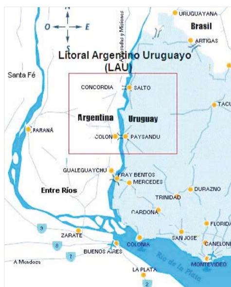
LITORAL. Zona donde se desarrolla el convenio entre los institutos de tecnología de Argentina y Uruguay.

Concluyó la primera etapa del convenio de cooperación mutua para el desarrollo productivo industrial del litoral argentino-uruguayo, firmado hace un año entre el INTI y su par uruguayo, LATU, con el apoyo de los municipios entrerrianos de Concordia y Colón y las intendencias orientales de Paysandú y Salto. Durante este período se identificaron las necesidades de los sectores de procesamiento de la madera, turismo y metalmecánica con el fin de formular las actividades a realizar y los recursos necesarios para concretarlas.