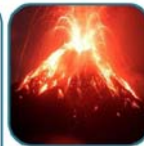
Arquetipo natural: Volcán o géiser