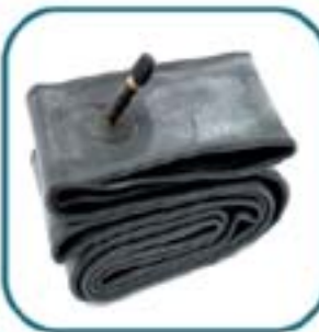
Arquetipo cultural: Cámara de bicicleta