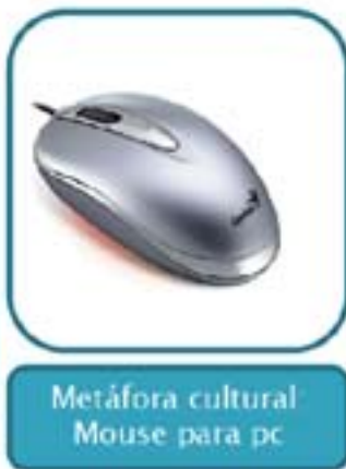
Metáfora cultural: Mouse para pc