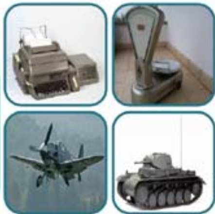
Metáfora cultural: Robustez, mundo post-guerra, la forma sigue la función.