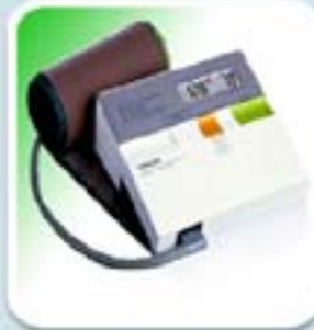
OMRON HEM-400C (1985)

El nuevo método anercoide, permite carecer de la columna de mercurio y el necesario espacio que esta ocupa, reduciendo los tamaños, en este caso el fabricante adhiere también un oscilómetro al producto.