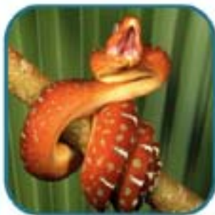
Arquetipo natural: Serpiente