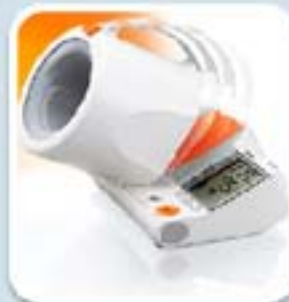
OMRON HEM-1000 (2004)

Con la llegada del nuevo siglo, los tensiómetros se hacen comunes en más de 100.000 hogares de todo el mundo, las nuevas tendencias apuntan a un uso más personal y de identidad, los del muñequera empiezan a ganar terreno, este es el más pequeño del mundo...