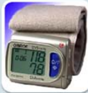
OMRON HEM-630 (2000)

Para vencer la competencia este tensiómetro incorpora el nuevo método de medición oscilo-métrico, además refleja estos adelantos tecnológicos con su discurso.