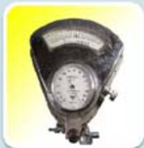
RIESTER MINIMUS I (1940-50)

Se eligió este producto porque representa a los de antiguo funcionamiento por medio de columna de mercurio y responde a un diseño meramente funcional, fue uno de los primeros en abandonar la madera para diseñarse en metal.