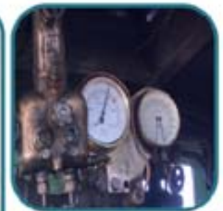
Arquetipo cultural: Calderas aneroides