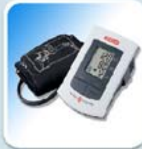
SAN-UP AU6109 (2005-ACT.)

Omron apunta a una claridad de diseño e integridad, propone y testea aparatos para que puedan ser usados por igual por las diferentes personas, sin importar estatura y peso, desarrolla para esto una nueva