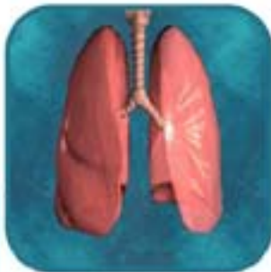
Arquetipo natural: Sistemas corporales