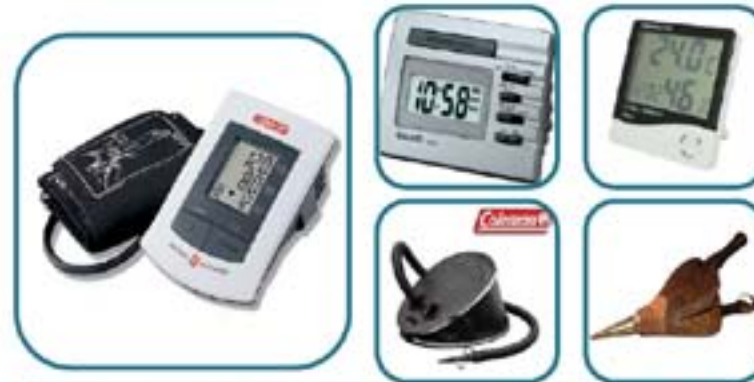
Metáfora cultural: Automatización de sistemas, fuente automático, la salud todos los días (despertador)