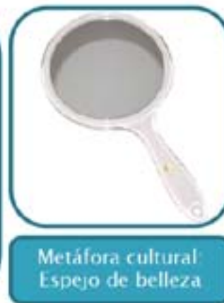
Metáfora cultural: Espejo de belleza