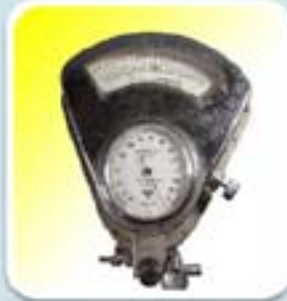
RIESTER MINIMUS I (1940-50)

La estrategia en este caso, es un cambio radical en los materiales a utilizar, se pasa de la madera de la caja contenedora al aluminio, mas resistente, liviano y práctico.