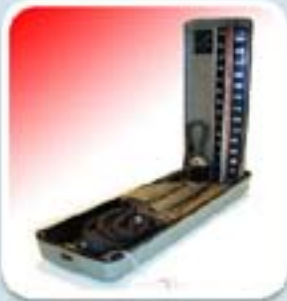
ERKAMETER 280 (1920-30)

La estrategia en este caso, es un cambio radical en los materiales a utilizar, se pasa de la madera de la caja contenedora al aluminio, mas resistente, liviano y práctico.