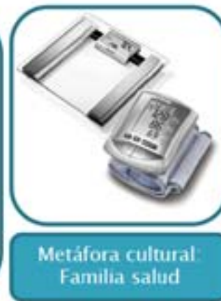
Metáfora cultural Familia salud