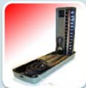
ERKAMETER 280 (1920-30)

Se eligió este producto porque representa a los de antiguo funcionamiento por medio de columna de mercurio y responde a un diseño meramente funcional, fue uno de los primeros en abandonar la madera para diseñarse en metal.