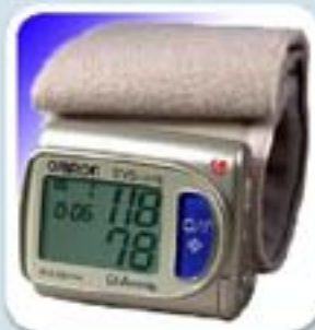
OMRON HEM-630 (2000)

Este tensiómetro de Omron representa los comienzos de la marca líder en tensiómetros digitales de hoy en día, y este en particular es el primero en incorporar el nuevo método de medición oscilométrico, además se ven marcadas en él, las nuevas tendencias tecnológicas!