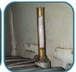
Arquetipo cultural: Termómetro