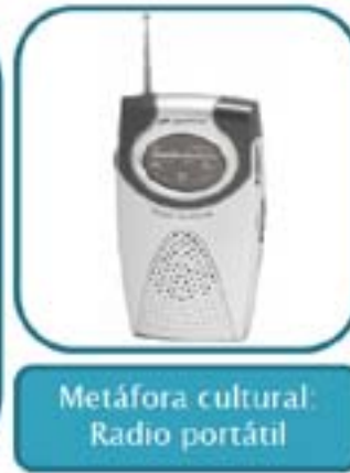
Metáfora cultural: Radio portátil