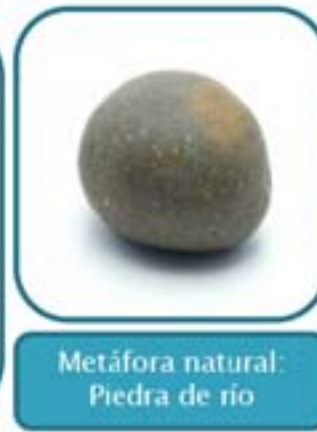
Metáfora natural: Piedra de río