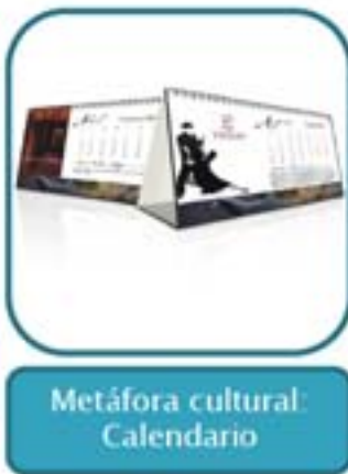
Metáfora cultural Calendario