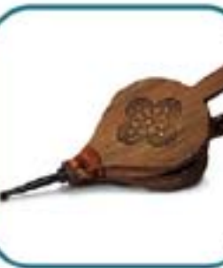
Arquetipo cultural: Fuelle