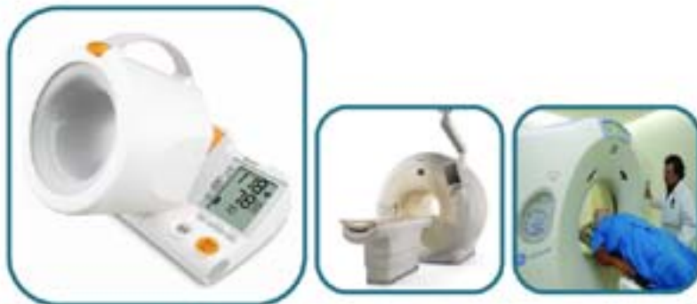
Metáfora cultural: Tecnología médica, pureza, avances científicos, diseño integral.