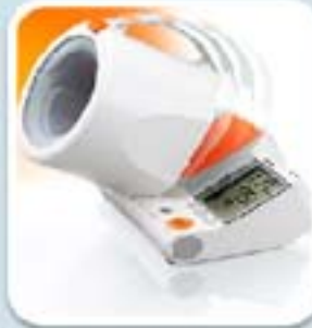
OMRON HEM-1000 (2004)

Las nuevas tendencias apuntan a un uso más personal y de identidad, los del muñequera empiezan a ganar terreno. Para ganar a sus competidores Omron decide fabricar el más pequeño del mundo.