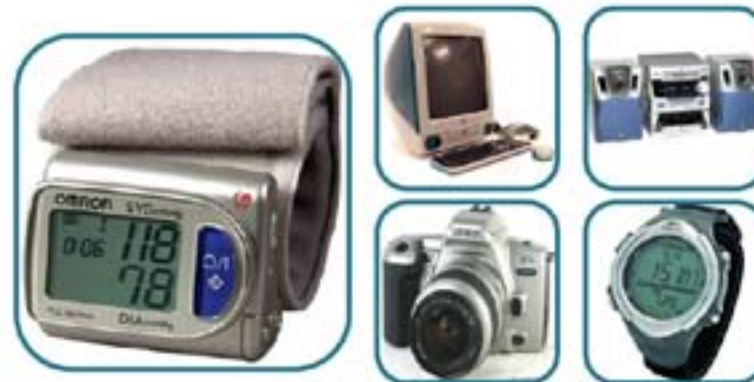
Metáfora cultural: Entretenimiento y tecnología, libertad del uso, vida cotidiana.