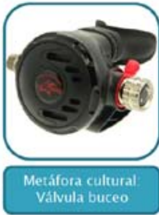
Metáfora cultural: Válvula buceo