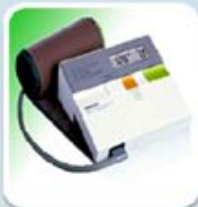
OMRON HEM-400C (1985)

Este producto se eligió por la época de su lanzamiento, la post-guerra, porque representa la llegada de una nueva forma de medición, el método aneroides, junto con la nueva ola de diseño "la forma sigue a la función"