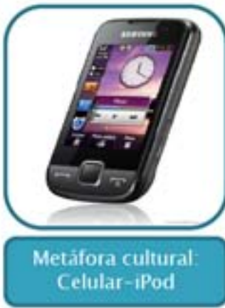
Metáfora cultural Celular-iPod