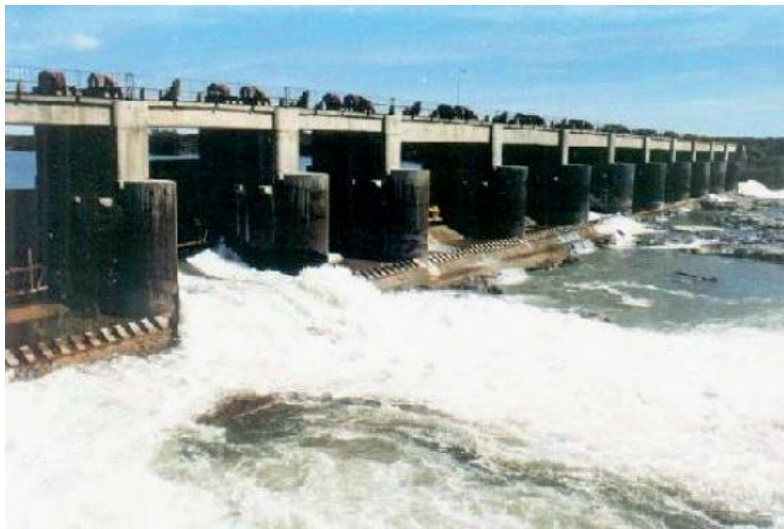
>> Presa de Salto Andersen Río Negro La Pampa

En relación a esto, es oportuno mencionar que los 35 proyectos mas grandes reúnen el 80% de la energía total de todo el inventario. Del análisis de ese subgrupo es posible señalar que: 10 proyectos se encuentran a un nivel de Anteproyecto o Proyecto Ejecutivo (2 en fase licitatoria), 13 mas a un nivel de prefactibilidad/factibilidad que resultaría útil continuar, y otros 12 a un nivel de desarrollo preliminar que es necesario mejorar. Akededor de 25 MW adicionales podrían provenir de la reconstrucción y/o modernización de una treintena de antiguas centrales que con el tiempo han ido quedando progresivamente desactivadas.